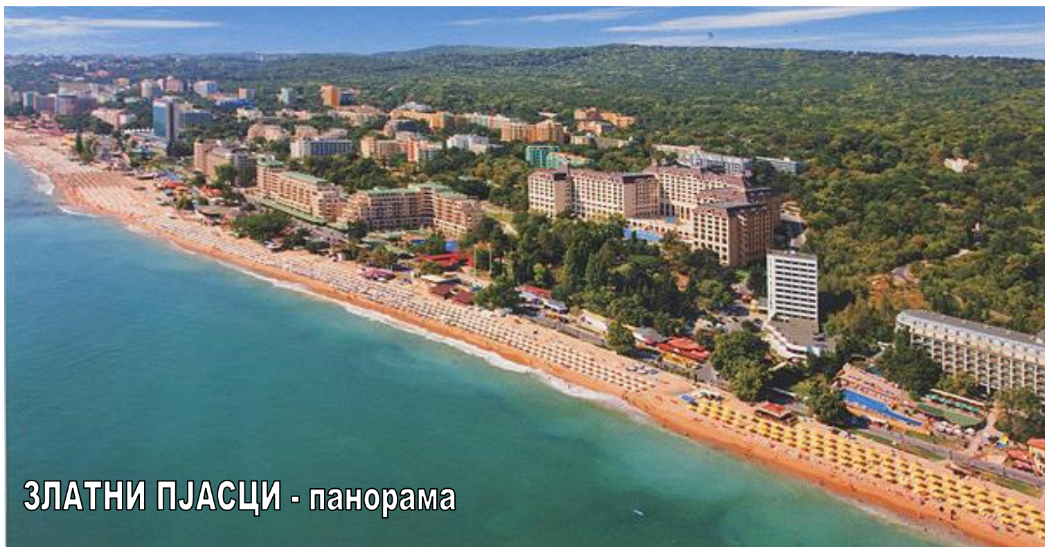
ЗЛАТНИ ПЈАСЦИ - панорама